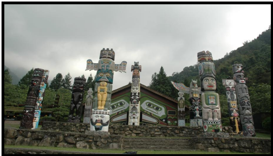
日月潭 九族文化村 印第安文化圖騰柱

協議，亦即當我們召喚，大靈即予以回應。此四種能量的開啟規律，儼然形塑為神聖象徵與動物崇拜的 圖騰柱